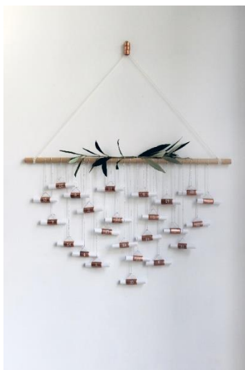
Calendrier de l'avent en cuivre pour toute la famille

Paris, le 9 novembre 2016 – À un mois des fêtes, il est temps de réfléchir à sa décoration de Noël. La tendance 2016, portée par les créateurs et bloggeurs, fait la part belle aux matériaux bruts. Le cuivre , avec sa couleur rouge orangée s'intègre parfaitement à la décoration de Noël, et offre une alternative aux classiques combinaisons de couleurs dorées, blanches, et vertes... Pour créer une atmosphère de fête unique, voici une sélection de DIY qui conjugue créativité et simplicité grâce à la malléabilité et l' esthétisme du métal rouge.