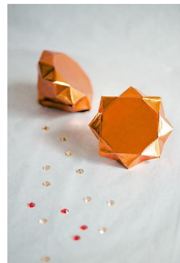
Origamis en feuilles de cuivre pour réinventer la décoration du sapin

À Noël, les esprits créatifs sont en éveil car le premier ingrédient pour des fêtes réussies est une décoration qui enchantera petits et grands... et bien sûr, dans l'air du temps ! Voici une sélection de tutoriels de bloggeuses qui ont choisi le cuivre pour réaliser un décor de Noël résolument tendance. Le cuivre reste en effet un incontournable de cet automne-hiver 2016 pour la plupart des enseignes déco – Maisons du Monde lui a même consacré une collection dédiée : Modern copper .