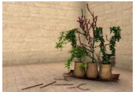
Jardinière Vert comme cuivre

Le titre de la création fait allusion à la fois à la patine vert amande du cuivre mais aussi au vert des plantes que cette jardinière antiparasite va accueillir. Cette réalisation a reçu le premier prix grâce à son utilisation astucieuse des propriétés du cuivre pour le jardinage. Le cuivre est souvent utilisé pour repousser certains nuisibles comme les limaces et les escargots qui ne supportent pas son contact. Dans cette création, le socle profite donc des vertus antibactériennes et antifongiques du cuivre pour repousser naturellement les indésirables, sans insecticide. Même en cas d'eau stagnante, larves de moustiques et mousses ne pourront se développer.