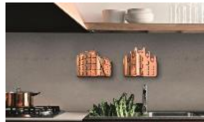
Moules à gâteaux Les délices italiens

Le deuxième prix est décerné à l'italien Francesco Costacurta pour sa collection de moules à pâtisserie clin d'œil à la culture culinaire italienne. En forme de monuments comme la tour de Pise ou le Colisée, Les délices italiens évoquent les ustensiles de cuisine traditionnels réalisés en cuivre et revisités ici sous un nouveau format plus créatif.