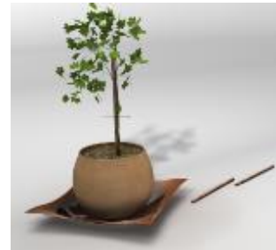
Etapas de montage de la jardinière avec ses différents éléments modulables

Une astuce en accord avec les tendances éco-responsables actuelles, puisque d'ici 2022, l'utilisation des pesticides sera interdite chez les particuliers : un bon moyen d'anticiper ! Autre atout, les pots et les tuteurs sont intégrés au support pour une prise en main facile. Tous ces éléments sont modulables et permettront de choisir la forme de la plante au fil de sa croissance.