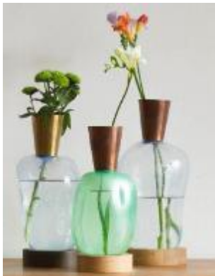
Vases soufflés de Ruben Johan Der Kinderen ©ECI