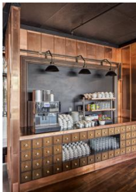
Hall habillé de cuivre de l'hôtel Radisson Blu Riverside, Göteborg