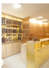
Paravent en cuivre de la Chambre aux confitures, Paris © Noël Dominguez Architecte / Fred Toulet Photographe