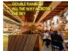
Comptoir en cuivre du restaurant Chi and Co, Sydney © Matt Woods Design