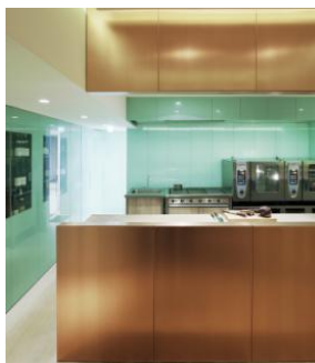
Restaurant Gastrologik Stockholm, Suède