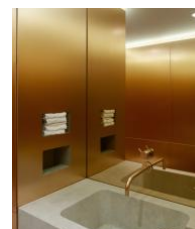
Intérieur paré de cuivre du restaurant "Gastrologik", Stockholm