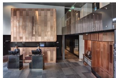
Radisson Blu Riverside Göteborg, Suède

Paris, le 22 juillet 2014 – En vogue auprès des architectes et des designers, le cuivre est également de plus en plus utilisé pour les aménagements intérieurs. Il peut former des cloisons ou délimiter des espaces, jouer le rôle de revêtement mural en habillant des surfaces à la manière d'une tenture métallique. Les projets emblématiques signés par des décorateurs et architectes d'intérieurs se multiplient à travers le monde.