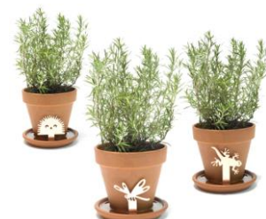
Lauréat pro 2007 : “Zzz” , Francesca Guicchio , Interno Design © COVO