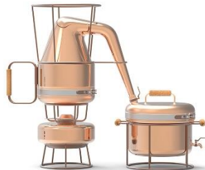
Lauréat pro 2013 : “Prohibition kit” , Francesco Morackini

Accessoires en cuivre destinés à la réhabilitation de patients atteints de disfonctionnements psychomoteurs. Le jury a salué la mise en avant de la malléabilité du cuivre